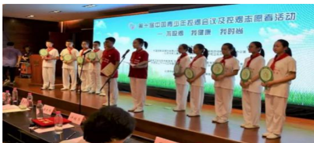
全国青少年控烟志愿者代表宣读“全国青少年控烟志愿者宣言”