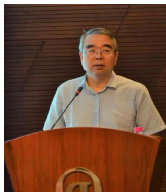
毛群安 国家卫计委宣传司司长