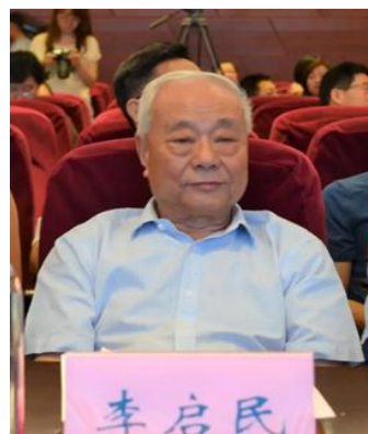
李启民 中国关心下一代工作委员会副秘书长