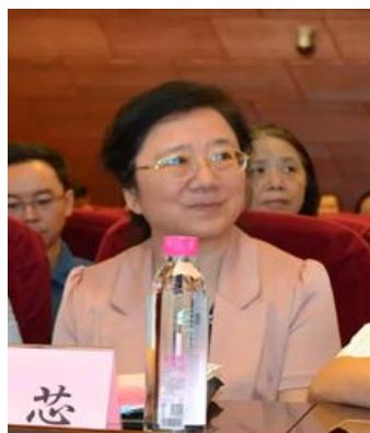
张蕊 教育部体育卫生与艺术教育司处长