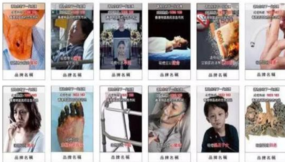
香港最新的12款警示图片

香港特区政府于6月通过卷烟包装扩大使用警示图片的规定，明确卷烟包装必须将警示图文面积扩大至85%，并要求轮流使用12种警示图片。这对控烟真是振奋人心的消息，这是香港又一控烟政策出台，香港又向更严的控烟政策迈了一大步。