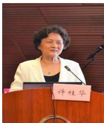
许桂华 中国控烟协会高级顾问 资深控烟专家