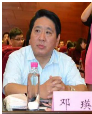
邓瑛 北京市疾控中心主任